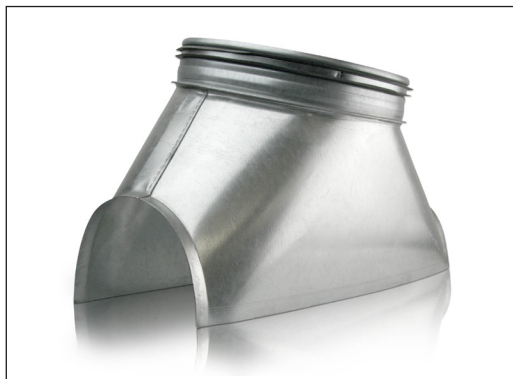
Excentrisk bygget saddestykke.